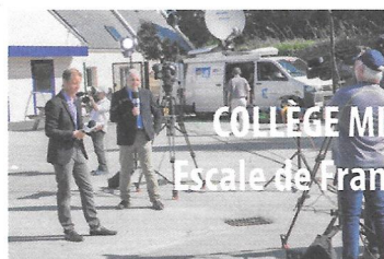
COLLÈGE MICHEL LOTTE Escale de France 3 Bretagne